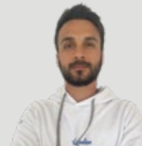
PREPARATORE FISICO I° GRADO