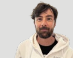
TECNICO DELLE ATTREZZATURE