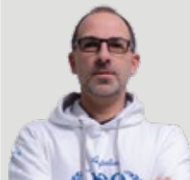
PREPARATORE FISICO II° GRADO