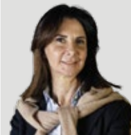
PREPARATORE MENTALE II° GRADO